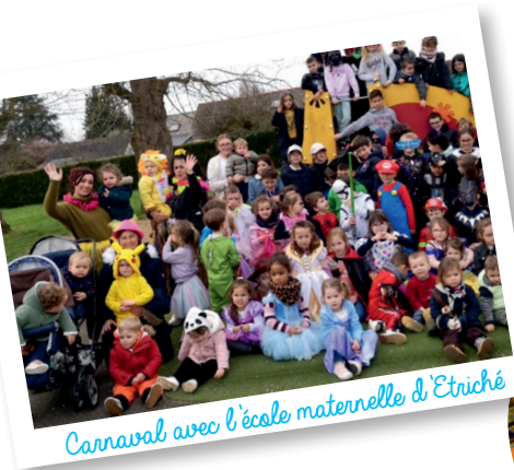
Carnaval avec l'école maternelle d'Etriché