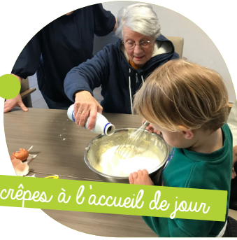
Vive les crêpes à l'accueil de jour