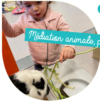
Médiation animale, pas trop près