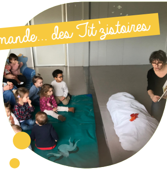
On en redemande... des Tit'zistoires