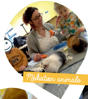
Médiation animale... en douceur