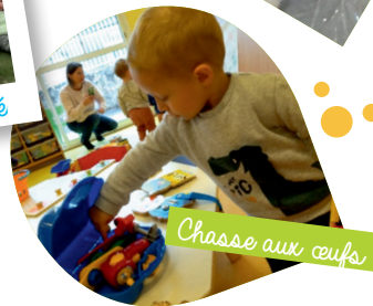
Chasse aux œufs