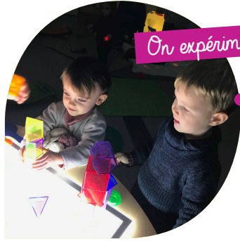
On expérimente Snoezelen