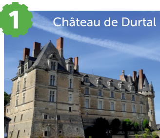
1 Château de Durtal