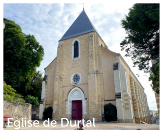
Eglise de Durtal

Dominant la vallée du Loir, le château Royal est un édifice médiéval construit aux temps des splendeurs de la royauté et accueillera au cours des siècles de grandes têtes couronnées françaises dont Henri II, Charles IX, Catherine de Médicis et Louis XII. Initié par Foulques Nerra et Geoffroy de Martel, Seigneurs d'Anjou, dès le XI ème siècle, son emplacement actuel a été choisi stratégiquement dans le but de protéger la ville d'Angers. Il sera agrandi entre les XV ème et XVII ème siècles, formant peu à peu un véritable patchwork architectural.