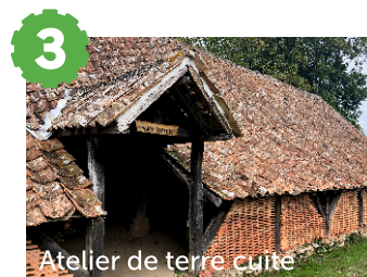
Atelier de terre cuite

Les Rairies, la terre cuite pour tradition ! Situé au cœur même de l'Anjou, le village des Rairies est un lieu où perdure la tradition de la fabrication des carreaux de terre cuite à l'ancienne et de tomettes. C'est la richesse immense du sol argileux du Pays Baugeois qui a fait de ce petit village le repère par excellence des fabricants de terre cuite dès le Moyen Âge et jusqu'au milieu du XX ème siècle.