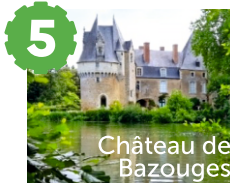
Château de Bazouges

4 Construit pour défendre le Haut-Anjou de toute velléité de la part de la Maison de Blois ou du comté du Maine, cette motte féodale est devenue forteresse au XII ème siècle puis demeure seigneuriale au XVIII ème .