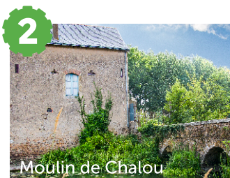
Moulin de Chalou

Visitez le faubourg côté sud du pont menant à son fort : le quartier St Léonard.