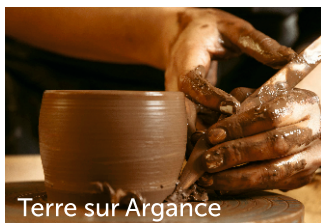
Terre sur Argance

L'église Notre Dame du Loir aurait été édifée au XII ème siècle.