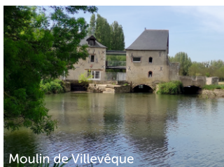
Moulin de Villevêque

Forteresse bâtie au XII ème siècle, cette ancienne résidence des évêques d'Angers a survécu à des siècles de guerre, de pillages et est passée par différents propriétaires. Elle sera vendue comme bien national à la Révolution, en 1791. Sont exposés dans les salles médiévales du château des sculptures, objets d'art, tapisseries et du mobilier.