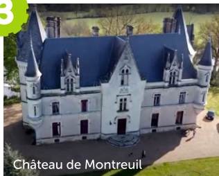
Château de Montreuil

Découvrez ce charmant château néo-gothique du XIX ème siècle, œuvre du célèbre architecte angevin René Hodé, dominant la vallée du Loir, qui coule en bas du parc, et la forêt de Boudré. Son parc agricole de 7 hectares fut dessiné par le comte de Choulot, créateur de 300 parcs. La Chapelle dans le bourg date du XIV ème siècle.