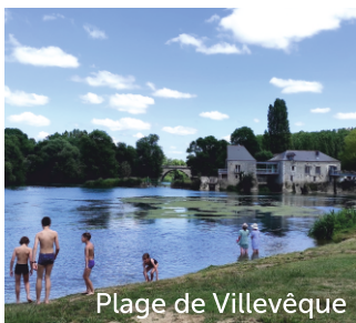
Plage de Villevêque

Ce moulin à eau du XIII ème siècle fut d'abord producteur de farine, de papier et d'huile. Il fabrique aujourd'hui de l'électricité ! A l'arrêt depuis la Seconde Guerre mondiale, il a été restauré et mis en valeur grâce à une scénographie pédagogique et des maquettes animées. Apprenez à moudre vous-même votre blé avec une meule manuelle !