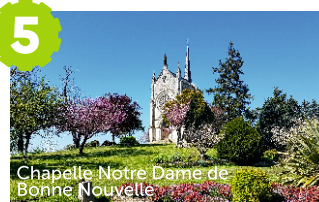
Chapelle Notre Dame de Bonne Nouvelle