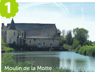
Moulin de la Motte

Le Moulin de la Motte tel qu'il se présente aujourd'hui, remonte en grande partie au XV ème siècle. Il possédait 4 roues et était utilisé pour écraser le blé. Plus tard, au XIX ème siècle, il est utilisé aussi pour le tan et le chanvre. Il fût doublé d'un moulin à vent qui prenait la relève lorsque les inondations ne permettaient plus au premier de fonctionner. En 1480, la Motte de Corzé devient une seigneurie, puis un ancien logis noble.