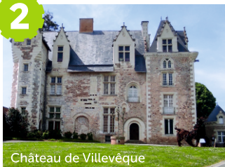
Château de Villevêque

Forteresse bâtie au XII ème siècle, cette ancienne résidence des évêques d'Angers a survécu à des siècles de guerre, de pillages et est passée par différents propriétaires. Elle sera vendue comme bien national à la Révolution, en 1791. Sont exposés dans les salles médiévales du château des sculptures, objets d'art, tapisseries et du mobilier.