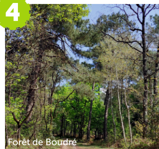
Forêt de Boudré