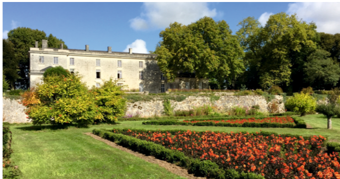
Jardins du Château de Jarzé