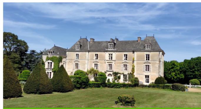
Jardins du Château de Chambiers