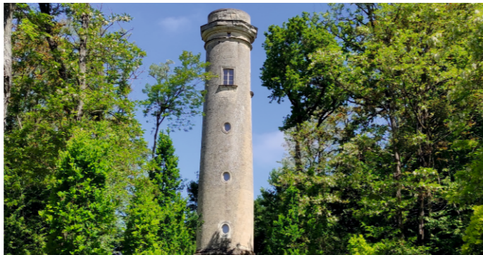
Tour de Cornillé-les-Caves