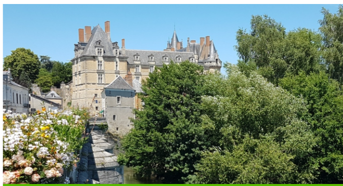
Château de Durtal