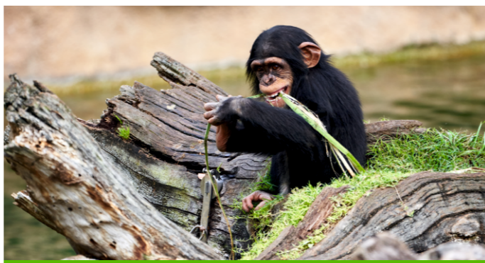
Zoo de la Flèche