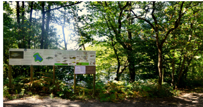
Panneaux éducatifs en forêt de Chambiers