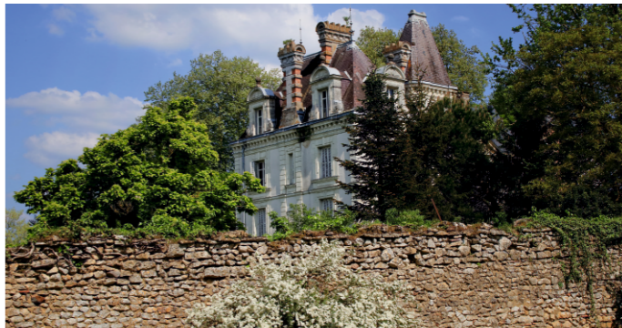
Château de la Fontaine à Montigné-les-Rairies