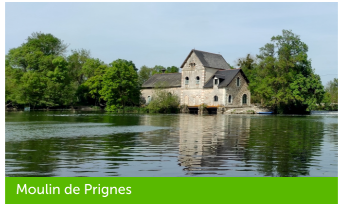
Moulin de Prignes