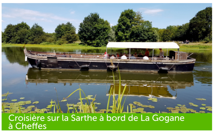
Croisière sur la Sarthe à bord de La Gogane à Cheffes