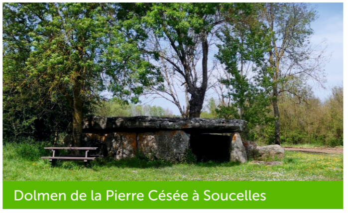
Dolmen de la Pierre Césée à Soucelles