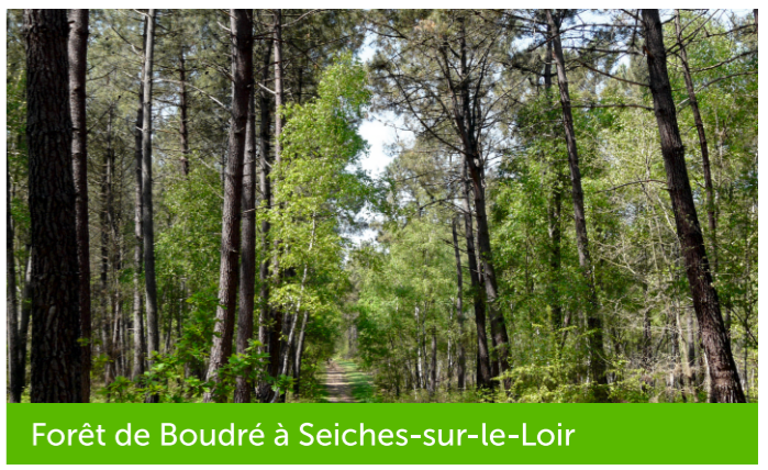
Forêt de Boudré à Seiches-sur-le-Loir