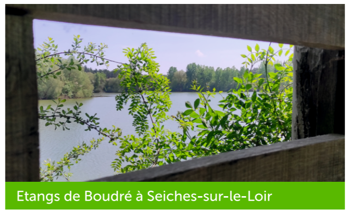
Etangs de Boudré à Seiches-sur-le-Loir