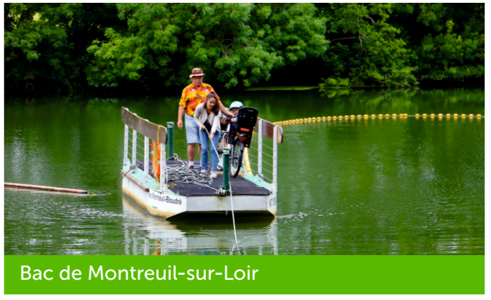
Bac de Montreuil-sur-Loir