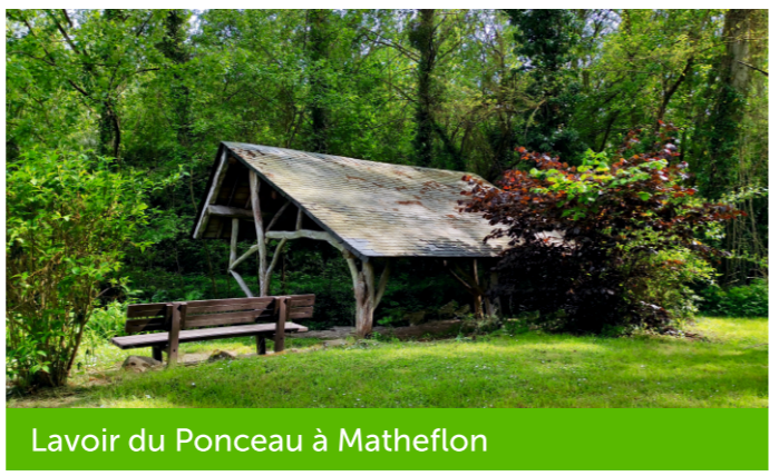
Lavoir du Ponceau à Matheflon