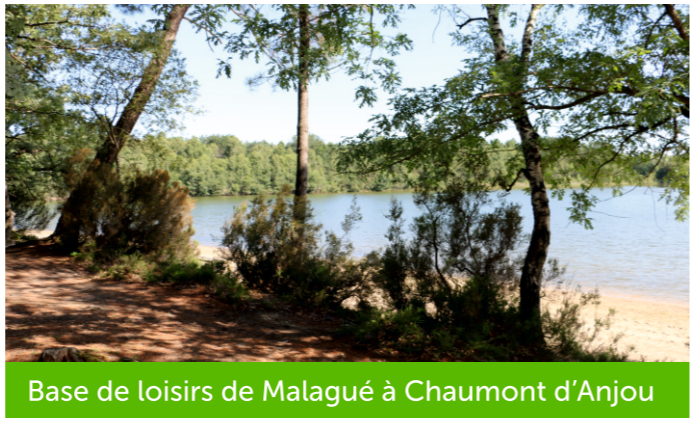
Base de loisirs de Malagué à Chaumont d'Anjou