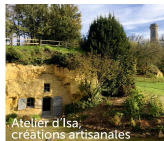
Atelier d'Isa, créations artisanales

Au sud-est du village, au détour de la rue de la Charpenterie, vous pouvez apercevoir la Tour de Cornillé. Véritable curiosité locale s'apparentant à un phare, elle fut construite au XIX ème siècle.