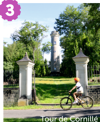
Tour de Cornillé

Au sud-est du village, au détour de la rue de la Charpenterie, vous pouvez apercevoir la Tour de Cornillé. Véritable curiosité locale s'apparentant à un phare, elle fut construite au XIX ème siècle.