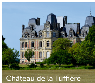
Château de la Tuffière

En direction de Seiches, au milieu d'un site naturel boisé de 8 hectares, arrêtez-vous au Lac de Malagué. Une guinguette et des activités de loisirs pour tous vous sont proposées.