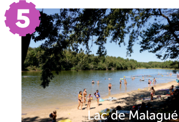
Lac de Malagué

Le château du Rouvoltz est une ancienne maison de maître construite au XVIII ème siècle et attribué à Delarue. Il servit aussi d'hôpital militaire pendant la guerre de 1914-1918.