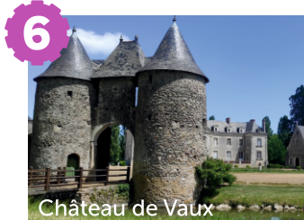
Château de Vaux

Ce vignoble en A.O.P. Anjou, est implanté depuis le XV ème siècle, grâce à des moines. Le nom du domaine « la Tuffière » caractérise son terroir avec un sous-sol de tuffeau et ses caves troglodytes. Labels : Caves touristiques du vignoble de Loire / Vignobles & Découvertes.