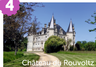
Château du Rouvoltz

Le château du Rouvoltz est une ancienne maison de maître construite au XVIII ème siècle et attribué à Delarue. Il servit aussi d'hôpital militaire pendant la guerre de 1914-1918.