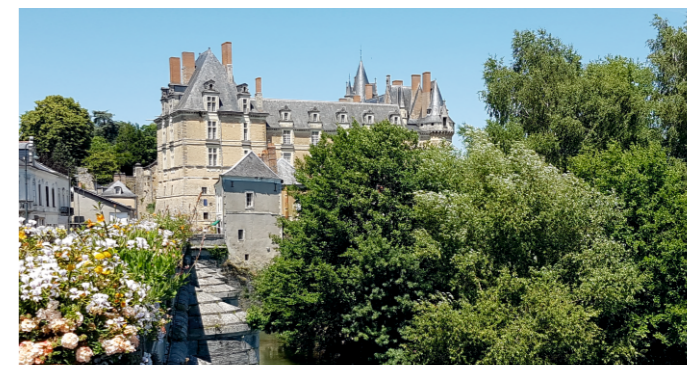
Château de Durtal