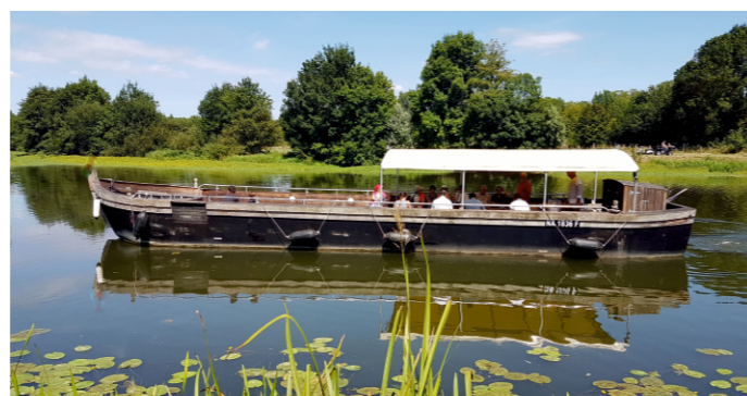
Croisière sur la Sarthe à bord de La Gogane à Cheffes