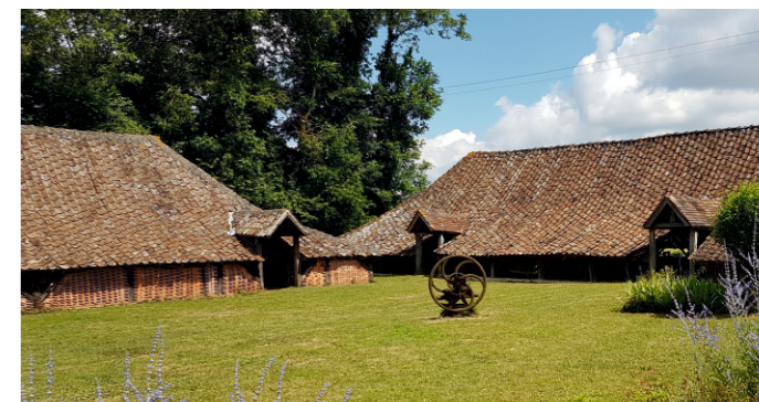
Atelier de terre cuite aux Rairies