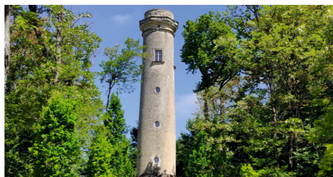
Tour de Cornillé-les-Caves