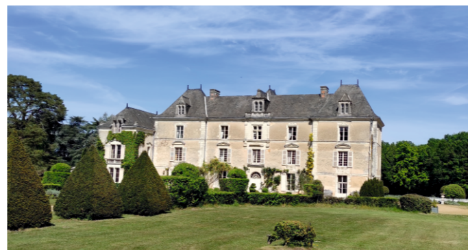
Jardins du Château de Chambiers