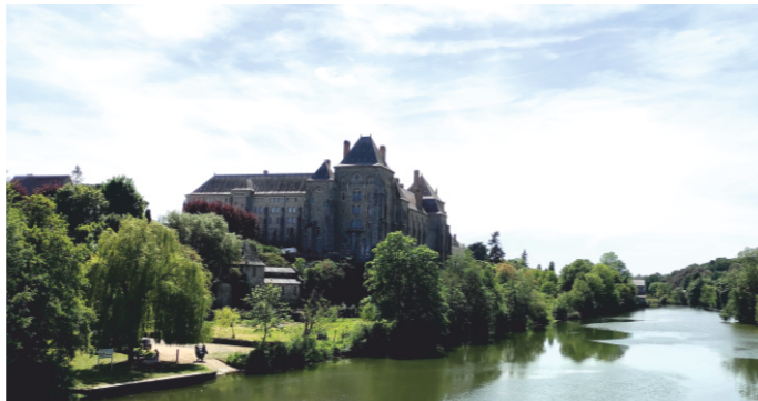
Abbaye de Solesme