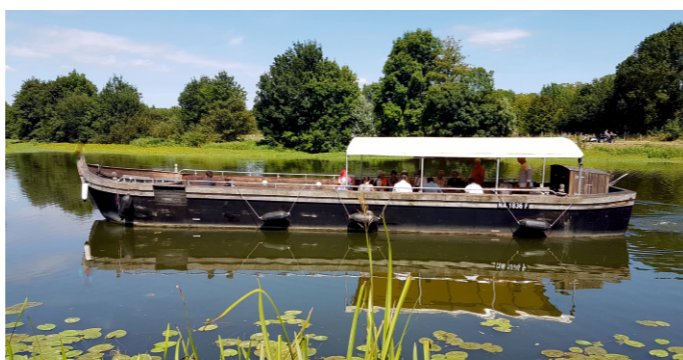
Croisière sur la Sarthe à bord de la Gogane à Morannes