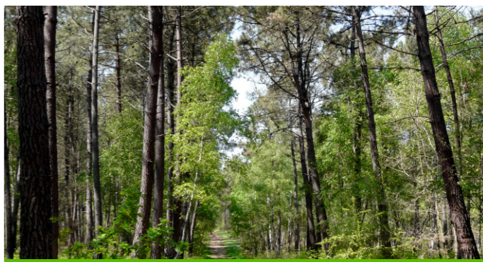
Forêt de Boudré à Seiches-sur-le-Loir