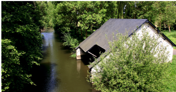
Lavoir à Chemiré-sur-Sarthe