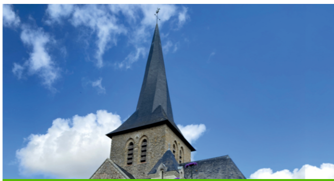
Clocher tors de Chemiré-sur-Sarthe