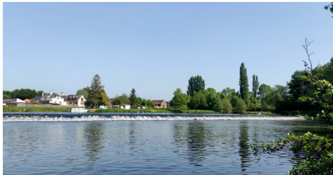
Les bords de Sarthe