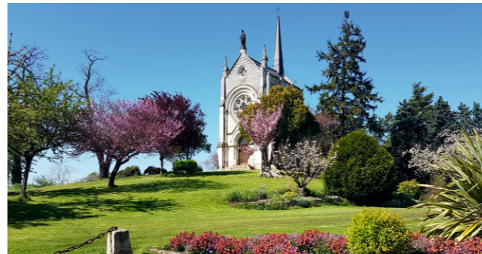
Chapelle de Matheflon à Seiches-sur-le-Loir