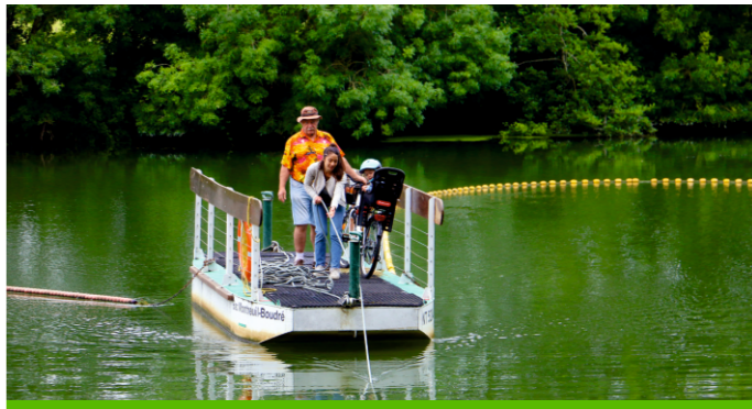
Bac de Montreuil-sur-Loir