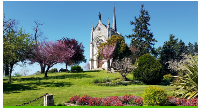
Chapelle de Matheflon à Seiches-sur-le-Loir