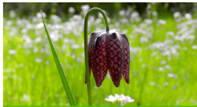
Les basses vallées angevines