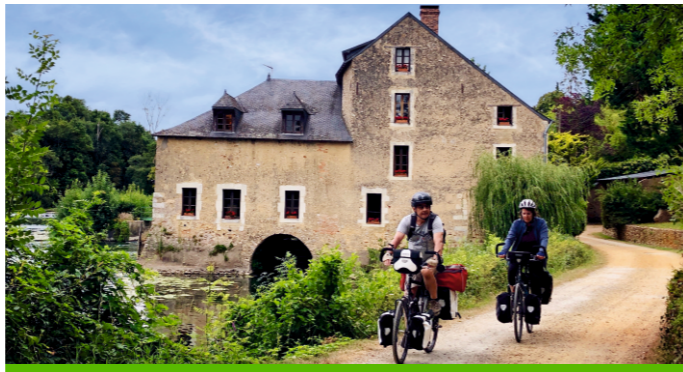
Moulin de Matheflon