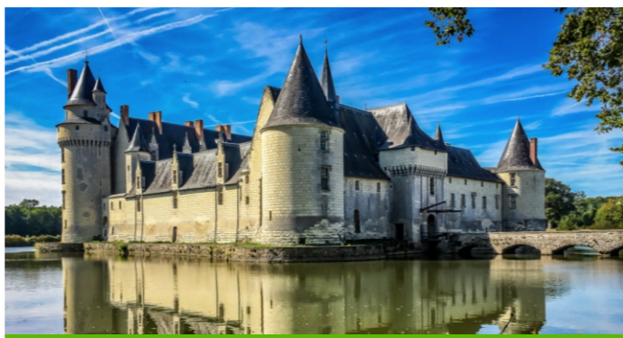
Château du Plessis-Bourré à Ecuillé